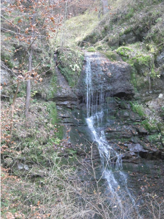
Wasserfall bei der Mariensäule