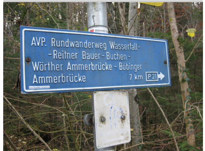
Wegweiser P21 Autor: Klaus Kreuzer