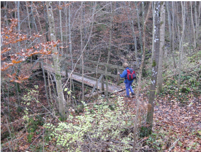
Über diese Brücke mußt du geh'n