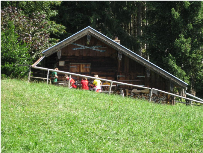
Hütte an der Sonnatratzen