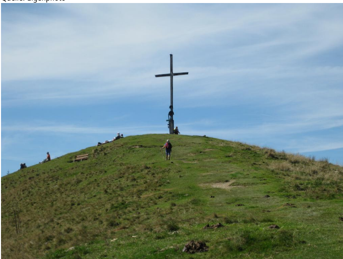
Großes Gipfelkreuz auf dem Zwiesel