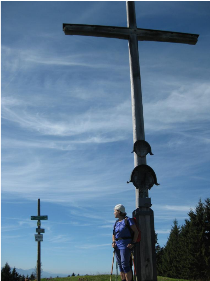
Großes Gipfelkreuz auf dem Zwiesel